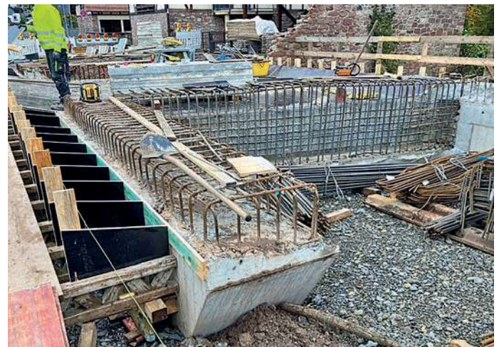
Abb.: Schalungs- und Bewehrungsarbeiten am Brücken Überbau

Aktuelle Bauarbeiten/Mitteilungen: Schalungs- und Bewehrungsarbeiten am Brücken Überbau