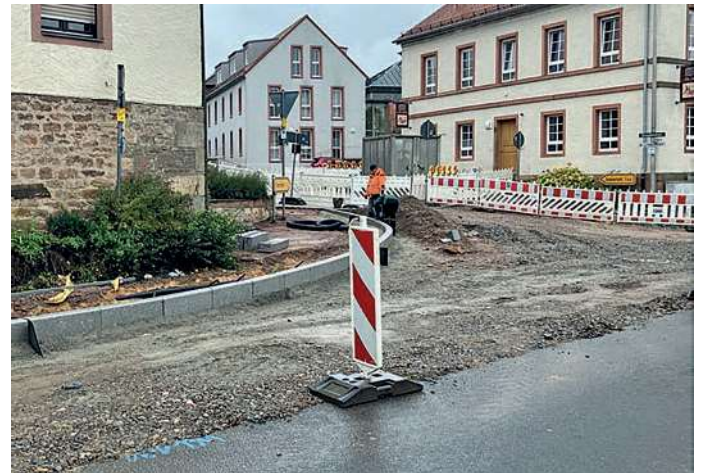
Abb.: Neue 2-zeilige Rinne mit Granitbordstein